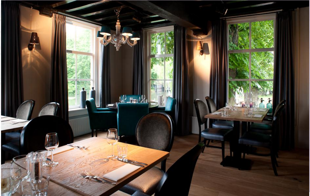
Restaurant, aanzicht van de opkamer