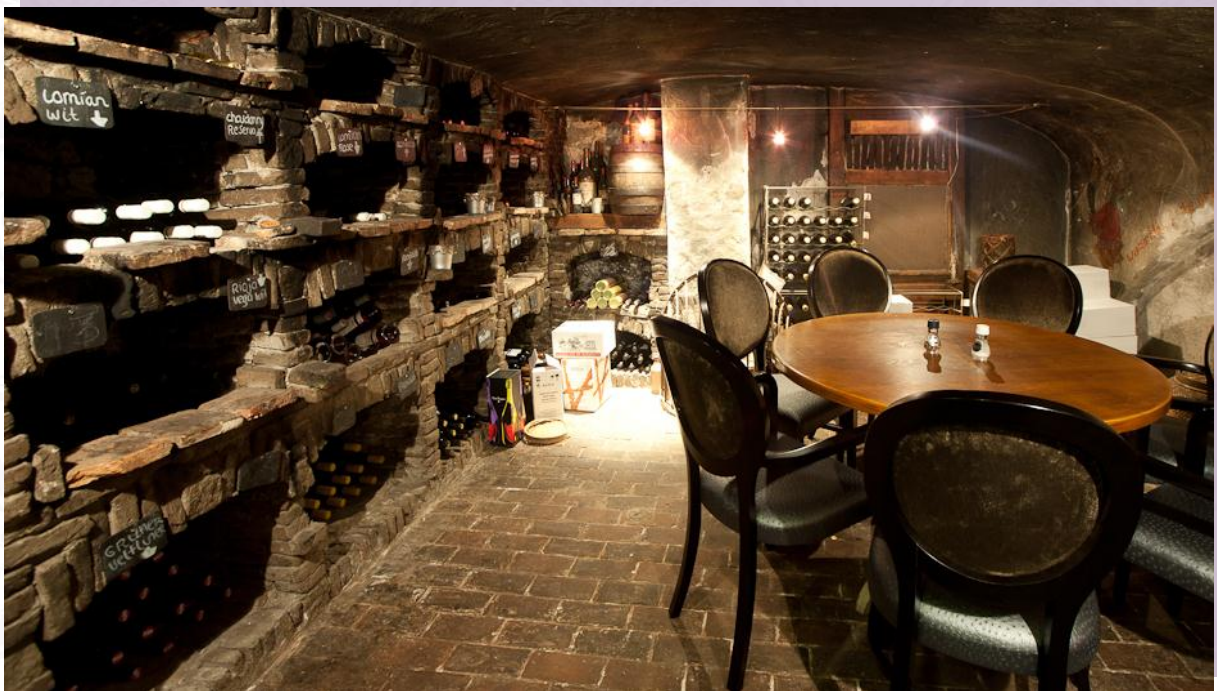
Wijnkelder, aanzicht vanaf de ingang