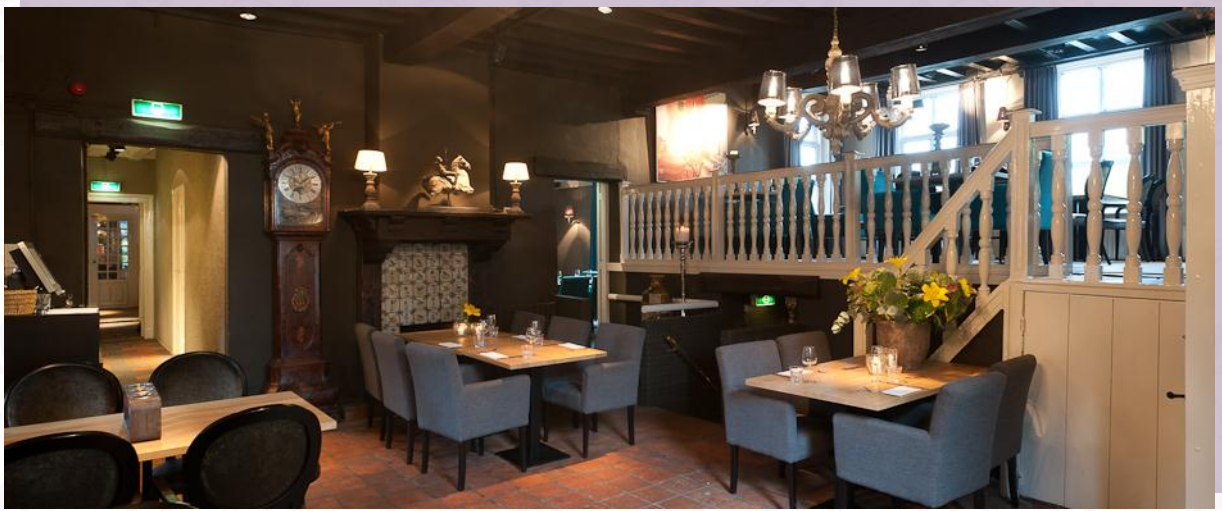
Restaurant, aanzicht vanaf de parterre