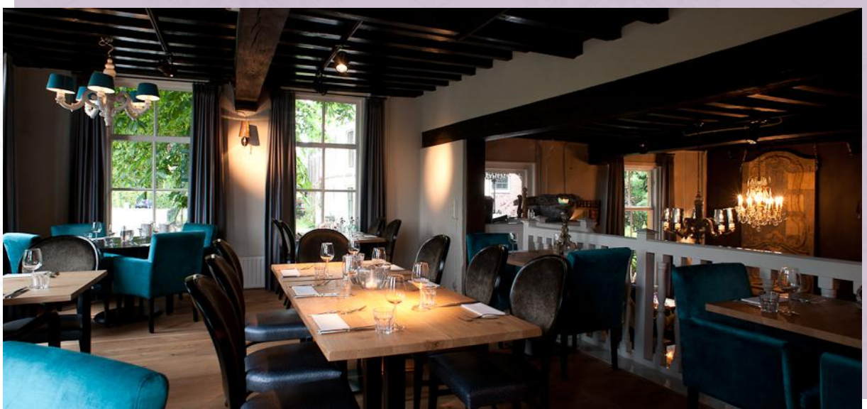
Restaurant, aanzicht vanaf de opkamer